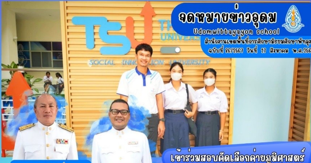
นายพลตรี ดำช่วย

สำนักงานเขตพื้นที่การศึกษามัชฌิมศึกษาพิจิตร ฉบับที่ 86/2567 วันที่ 17 มิถุนายน พ.ศ.2567